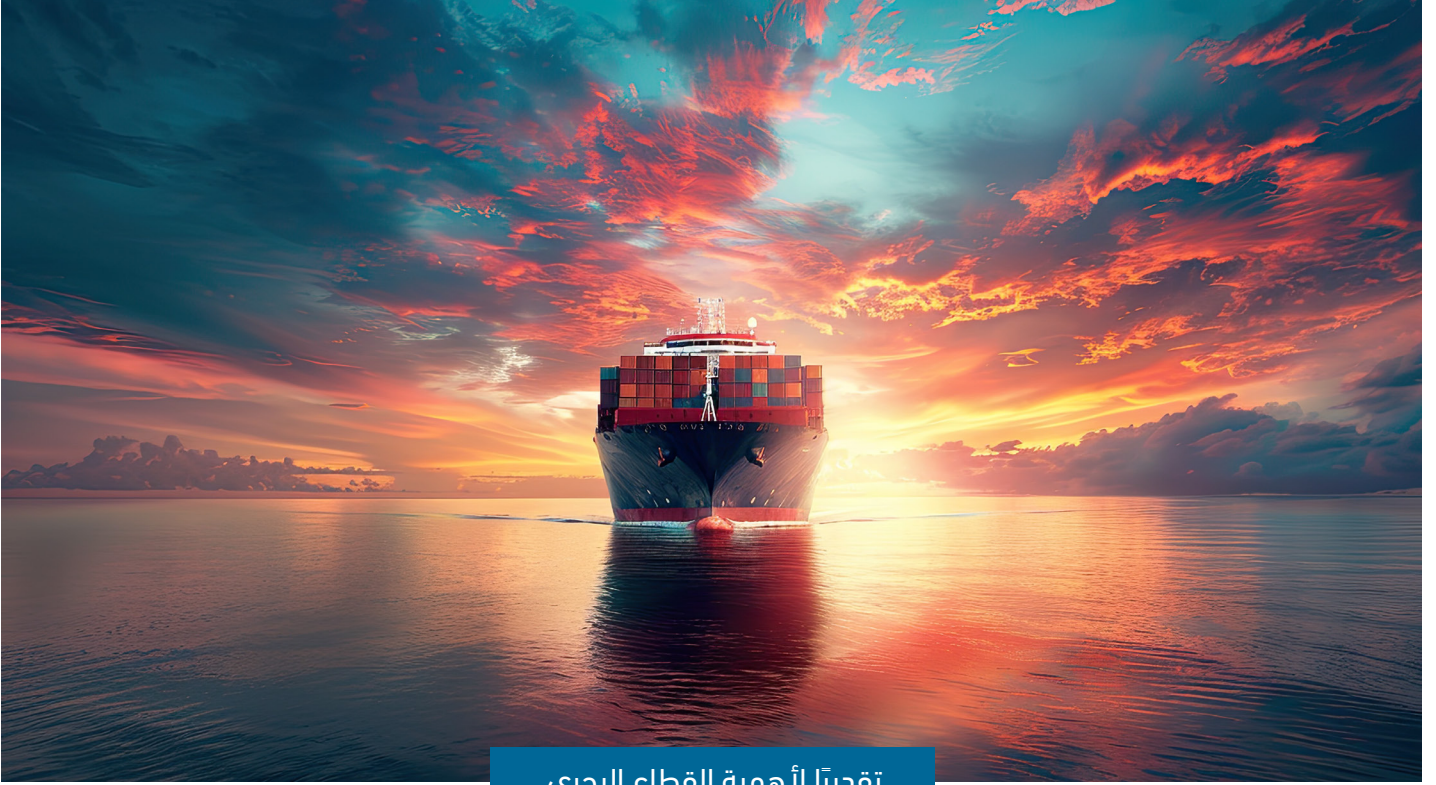
تقديرًا لأهمية القطاع البحري