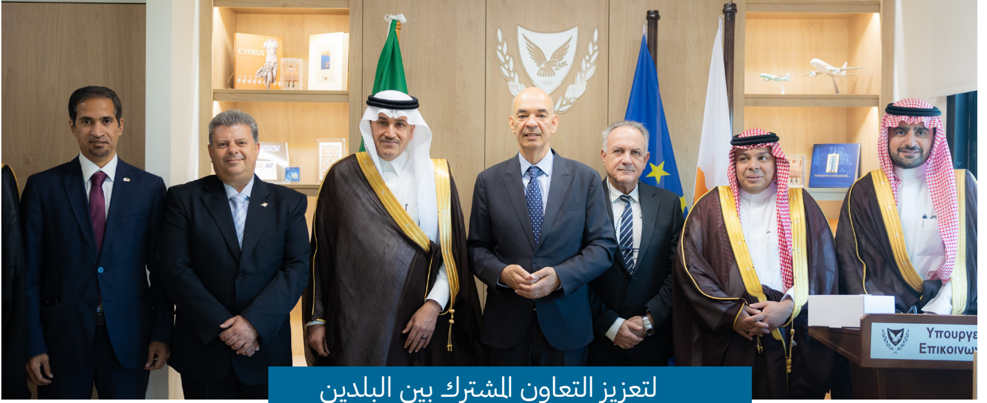
لتعزيز التعاون المشترك بين البلدين