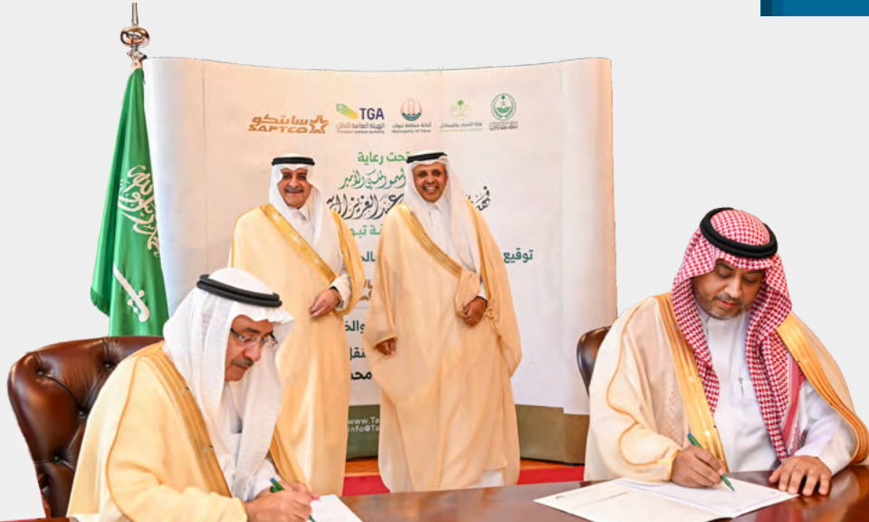
توفيراً لنقل عام فعال ومستدام