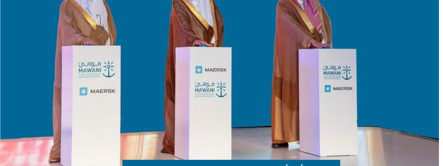
أحد أكبر المناطق اللوجستية في المملكة