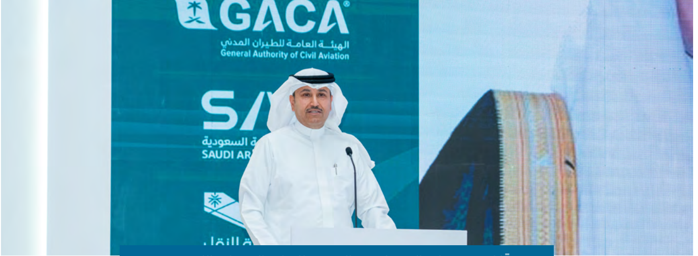
تحقيقًا لمستهدفات الاستراتيجية الوطنية للنقل والخدمات اللوجستية